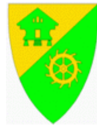
Nore og Uvdal